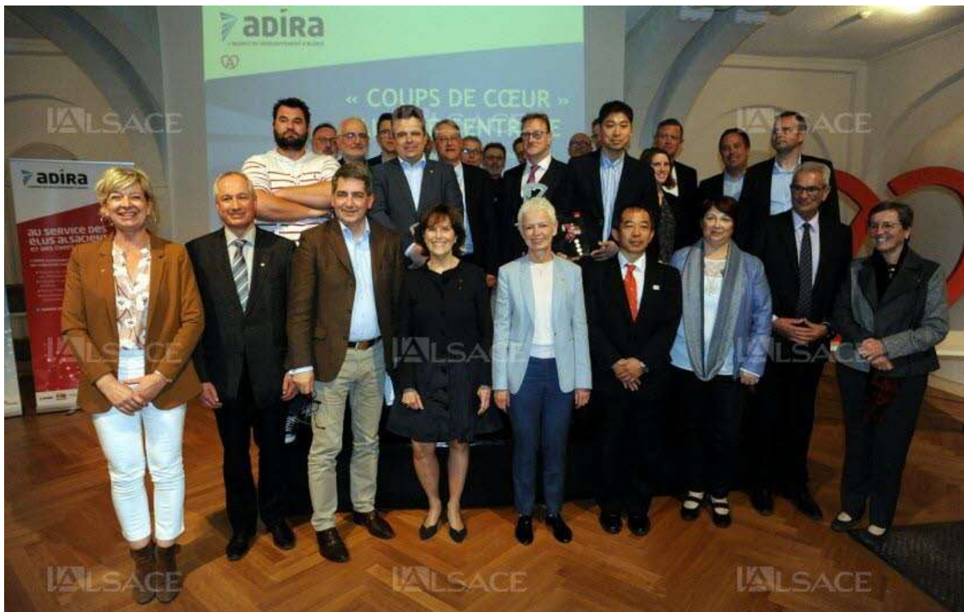
Les lauréats 2019, entourés des partenaires de l'événement et des invités.

Le 03/04/2019 18:30 par M.F. , actualisé à 18:41 Vu 264 fois